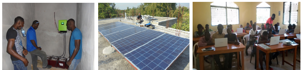
Modernisation de l'école Massawist à Verrettes. Projet Comoseh. Sécurisation de l'étage, fenêtres, électrification solaire, toilettes neuves au 1 er étage, salle informatique. A droite : le premier stage en salle info.