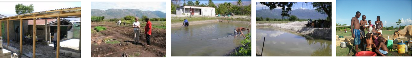
1. Reconstruction Ecole fraternité. P. au Prince. 2. Agro-pisciculture à Thomazeau ( Plaine du Cul de Sac.) 3 à 5 : Bassins d’élevage de Tilapias associés à des cultures vivrières et à l’élevage avec SOS Enfants. Thomazeau. 5. Forage à Savane Laboue : eau potable et eau pour irrigation pour 600 habitants.