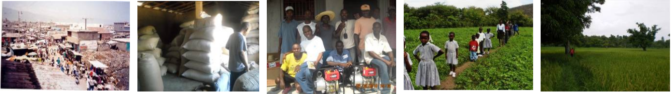
1. Cité Soleil. Port au Prince. 2. Aide Alimentaire d’urgence. 3. Mécanisation irrigation, jardins communautaires : Verrettes. 4. Aide à l’agriculture vivrière. Mirault. Artibonite.. 5. Aide aux jardins communautaires : riziculture. Verrettes. Deschapelles. Artibonite.