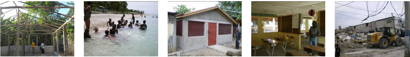
1. Construction d’un poulailler. Ecole Dumarsais, Verrettes. 2. Sortie plage, pour la seconde fois de leur vie, 100 enfants déshérités de Cité Soleil et Verrettes. 3. Construction Ecole Samaritain. Ouanaminthe. 4. Salles de classe Ecole Samaritain. 5. Reconstruction Ecole Sacré Cœur. P. au Prince.