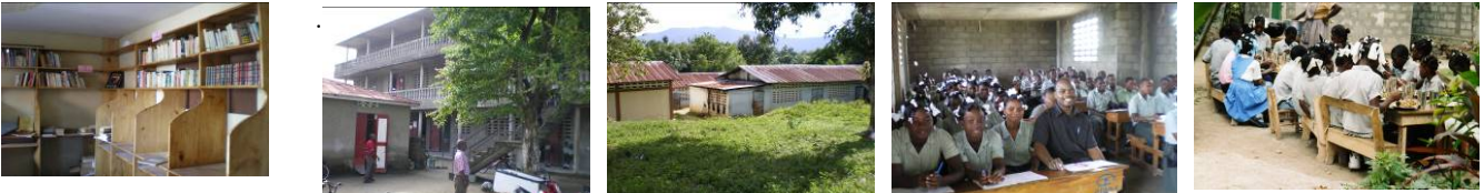
1. Bibliothèque et centre informatique, Collège de l’Etoile. Ouanaminthe. 2. Collège de l’Etoile. Ouanaminthe. Nord-Est. 560 élèves. 3. Lycée de Capotille. (Nord-Est) . 4. Classe du lycée de Capotille.. Nord-Est. . (450 élèves). 5. Cantine du collège de Verrettes. Artibonite.