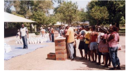
SEISME 2010 : distribution de vivres à Verrettes