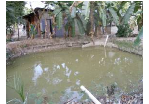
Pisciculture à Thomazeau

☐ Aide au développement de micro-élevages (poulets, chèvres,...)