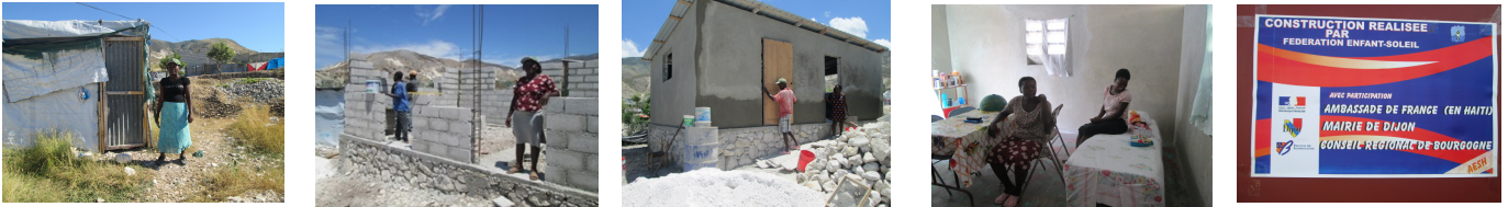
Onaville. Constructions pour des familles issues des camps ou sans logis. 1. Abris avant constructions. 2. Travaux avec les habitants et une équipe de maçons.. 4. Une des maisons presque achevée.. 4. Une famille installée dans son nouveau logement. 5.Nos bailleurs : Ambassade de France en Haïti. Mairie de Dijon. Conseil Régional de Bourgogne.