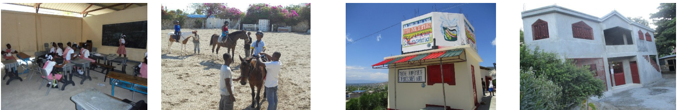
2017. Ci-dessus : 1 Ecole Belair. Avec l'association Timoun Restaveks, partenaire depuis 8 ans. 2 Equitation pour les enfants handicapés de notre maison de Pernier. 3 Construction d'une épicerie coopérative et d'un réservoir d'eau à Onaville. 4 Fin de la construction de l'école Massawist de Verrettes.