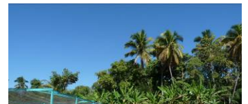
Pépinières et irrigation jardins