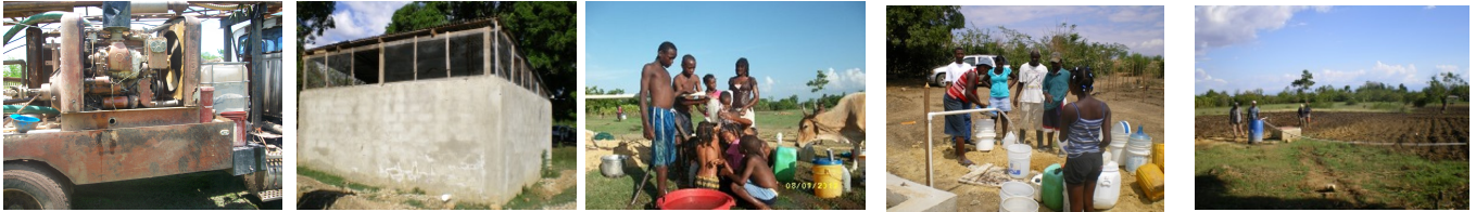
Savane Laboue. Plateau Central. 1 Forage pour l'eau potable et l'irrigation. 2. Bassin de retenue d'eau pour irrigation. 3. 4. Eau potable pour 600 personnes.(Savane Laboue) 5. Mise en valeur des terres pour les paysans pauvres, pépinière pour cultures vivrières, arbres fruitiers et forestiers pour reboisement.