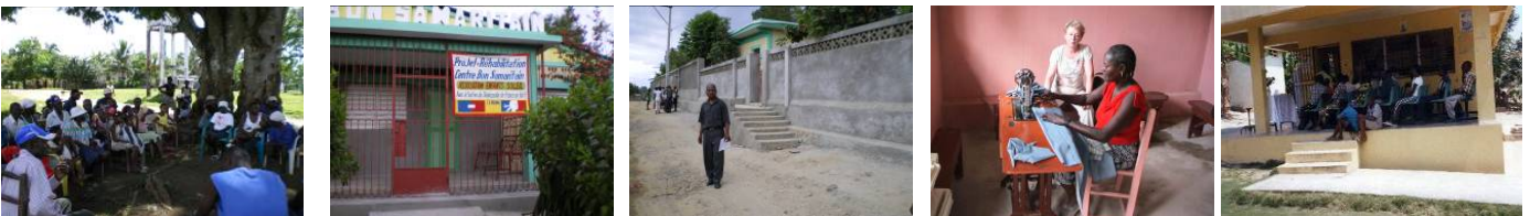
1. Réunion projet agricultures. Hinche. Plateau Central. 2. Réhabilitation Centre de Soins Bon Samaritain. Ouanminthe. Nord-Est. 3. Sécurisation Centre de Soins Bon Samaritain. 4. Partenariat ateliers Couture Broderie. Verrettes. 5. Dispensaire Capotille : partenariat. Campagne prévention : Hygiène , MST.Médicaments et matériel médical.