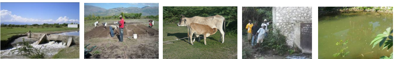
1: Barrage d’approvisionnement en eau des bassins d’élevage de Tilapias. 2 Cultures vivrières Thomazeau: pépinières.. 3. Elevage associé à la pisciculture et aux cultures vivrières. Thomazeau. 4 et 5. Adduction d’eau, citerne et élevage de Tilapias. Ecole Dumarsais Estimé Verrettes.